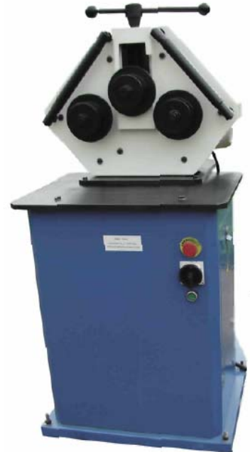
Ring und Profilbiegemaschine